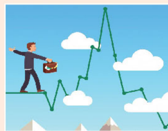
▲ 善用期權對沖，可有效降低投資風險。

首先必須強調造淡並不一定代表看淡後市，情況等同於去旅行買旅遊保一樣，買旅遊保並不代表閣下認為這一次旅行一定會出事，只不過希望用少少錢買個安心。