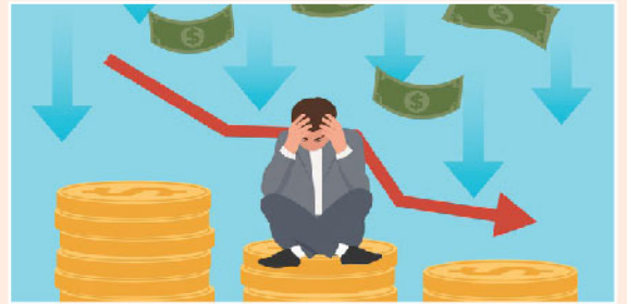
▲ 降級潮現，即使疫情過後投資者仍可能會寢食難安。

3:1，為金融危機以來最大差距。種種跡象均顯示，即使疫情過後，投資者仍可能會寢食難安。當然各國已肯定會拋出更多援助措施以企業加就業，但金融市場震盪仍難以預料。