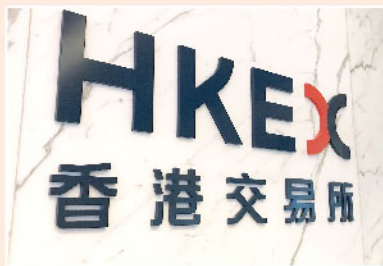
▲ 現階段港交所可看高一線。

研究報告期間，環球股市表現反覆，港股維持上落待變之格局，恒指大致上落於23500點至24500點區間之內，於此1000點波幅內窄幅上落等待突破。目前市場普遍相信股市最壞時刻已過，但好淡爭持角